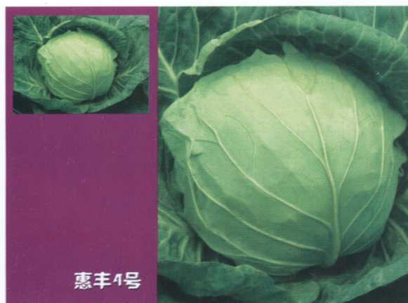
秋早熟甘蓝新品种‘惠丰4号’ (见1066页文)