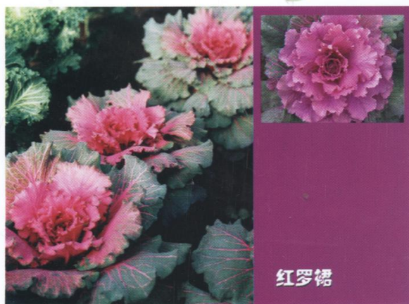
羽衣甘蓝新品种 ‘红罗群’和‘白罗群’ (见1071页文)