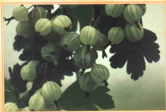
醋栗优良品种—坠玉 (见397页文)