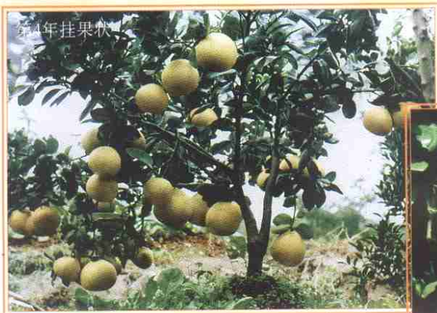
优质耐贮柚类新品种‘贡水白柚’ (见396页文)