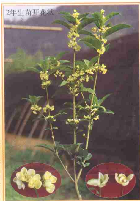
桂花新品种‘天香台阁’(见400页文)