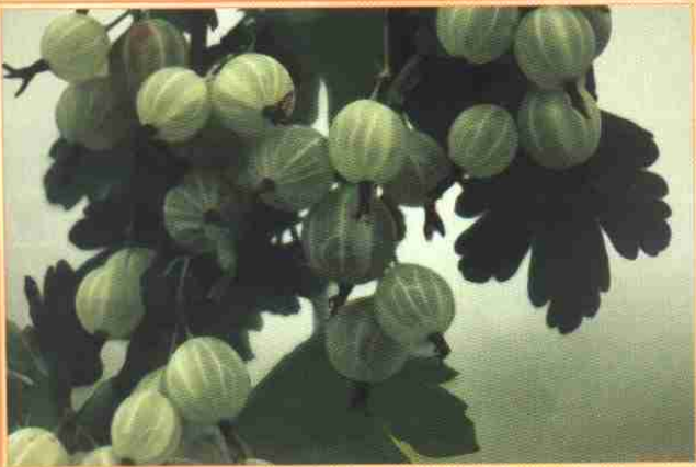
醋栗优良品种—坠玉 (见397页文)