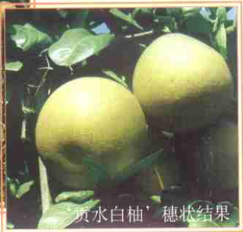
‘贡水白柚’穗状结果